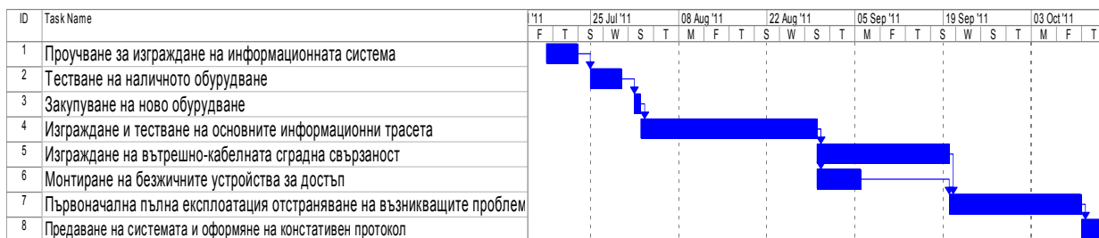
Фиг. 2 Действителен план на проекта по изграждане на системата

Забавянето на проекта бе свързано от една страна с натоварване на използваните ресурси по други проекти, както и възникнали мрежови проблеми от останалата недоизградена част на информационната мрежа. Допълнителното време бе свързано главно с диагностика и отстраняване на проблемите. След мерките които бяха свързани с диагностиката се взеха трайни мерки, които водят до качествената стабилизация на експлоатация на мрежовата система.