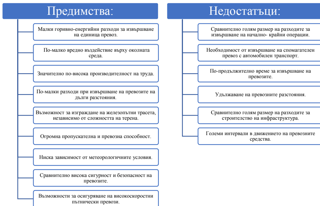
Фиг. 1. Предимства и недостатъци на железопътния транспорт

предпочитано средство за превоз на пътници и товари в рамките на Европейския съюз и му отреждат ключово място в създаването на стабилна мобилност за европейската транспортна система. Освен това трябва да се подчертае, че това е единственият вид транспорт, който е отбелязал спад на вредните емисии на въглероден диоксид, наред с увеличаване на обема на товарите през последните години.