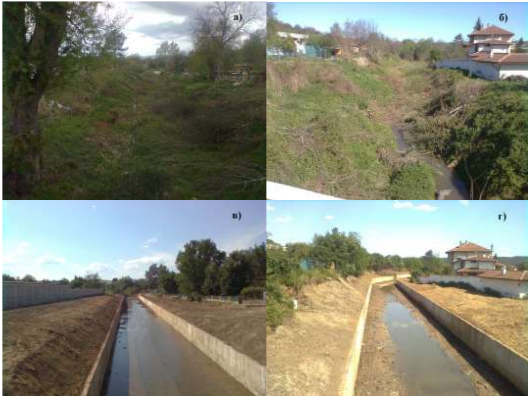
Фиг.4 Коритото на реката: а), б) преди корекцията; в), г) след корекцията.