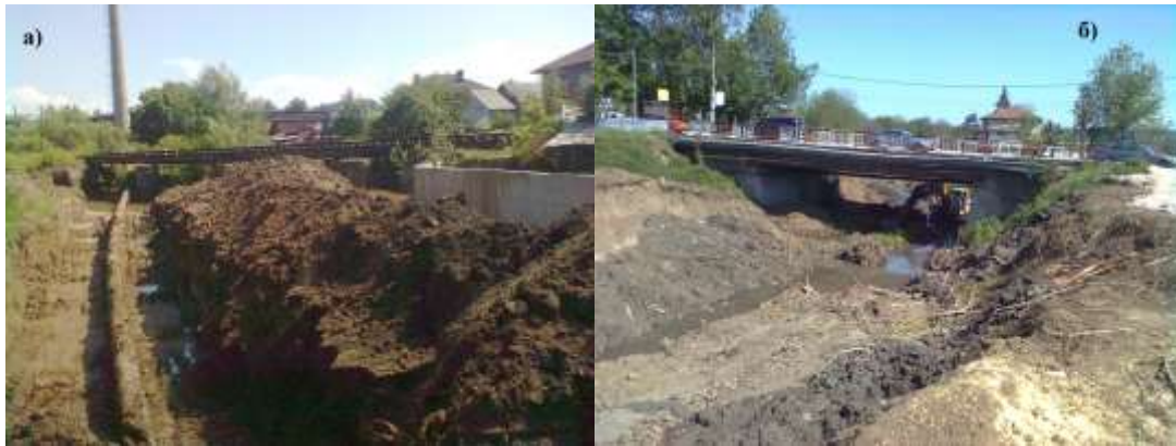
Фиг.2. Съоръжения в обхвата на корекцията: а) метален ж.п. мост; б) стоманобетонен автомобилен мост.

Около реката бреговете са оформени с насипи, достигащи височина до 4 - 5 м над речното ниво (фиг. 4 а), б). Насипните откоси са неустойчиви поради ерозия. В ниските брегови участъци реката формира разливи, а в речното корито – заблатявания.