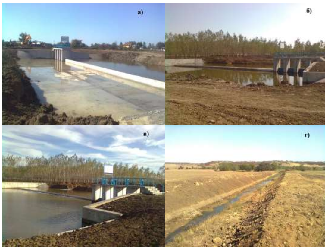
Фиг.5. Регулиращо съоръжение: а), б), в); предпазна дига: г).

Други мероприятия - почистване и продълбочаване на канал, захранващ рибарници.