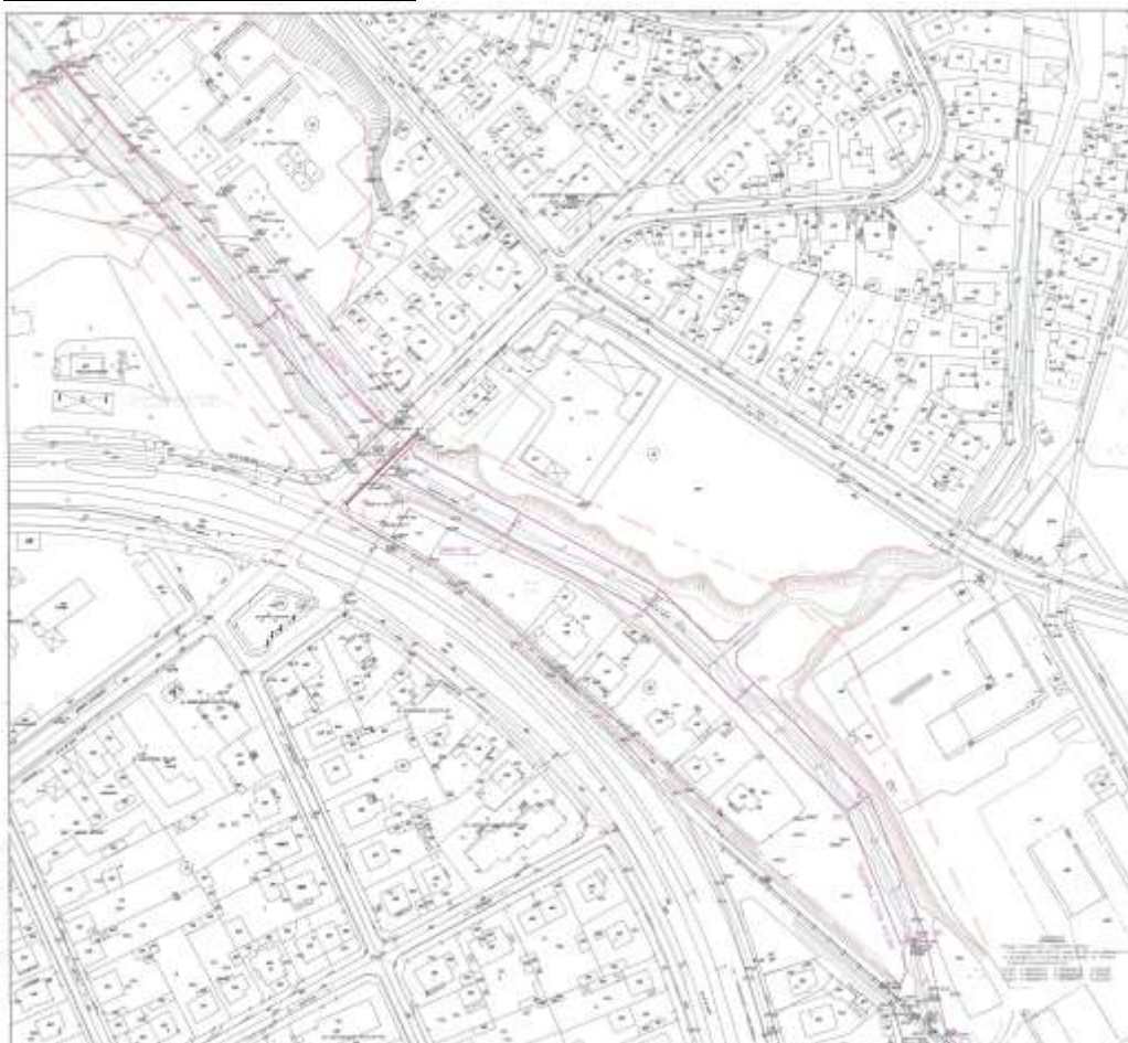
Фиг.1. Ситуационно решение [2]

Проектираното трасе срещу течението на реката започва от метален ж.п. мост (фиг. 2 а), разположен непосредствено над завод за обработка на скално-облицовъчни материали източно от жилищната зона на гр. Мездра, преминава на запад в подножието на хълма при стоманобетонен автомобилен мост (фиг. 2 а) за гр. Роман и достига до северната граница на детската градина, край левия бряг (фиг. 1).