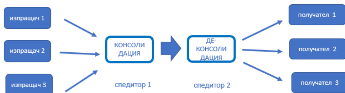
Фиг. 1 Класическа групажна линия

Групажът представлява организиране и извършване на транспорт със стоки, които идват от няколко изпращачи и са предназначени за един или повече получатели. Това решение е по-икономично от директния транспорт, но времето за доставка е по-дълго [5].