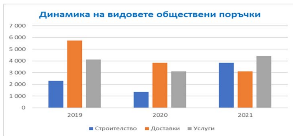
Фиг. 2. Динамика на обществените поръчки

Богатата база данни позволява да се прави задълбочен анализ на текущото състояние на пазара на обществените поръчки и да се проследяват тенденциите на развитие. (Фиг. 2)