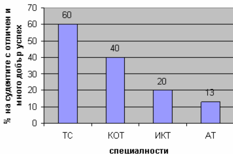
Фиг. 1. Резултати от учебната дейност след първата учебна година.

Втората група въпроси са от учебно-методичен характер и отразяват до каква степен е изострена научната критичност в студентите по отношение на преподавания материал, като се разкрият техните желания за разширяване на лекционния фонд, усъвършенстване формите за обучение и същевременно да покажат как студентите усвояват преподавания материал.