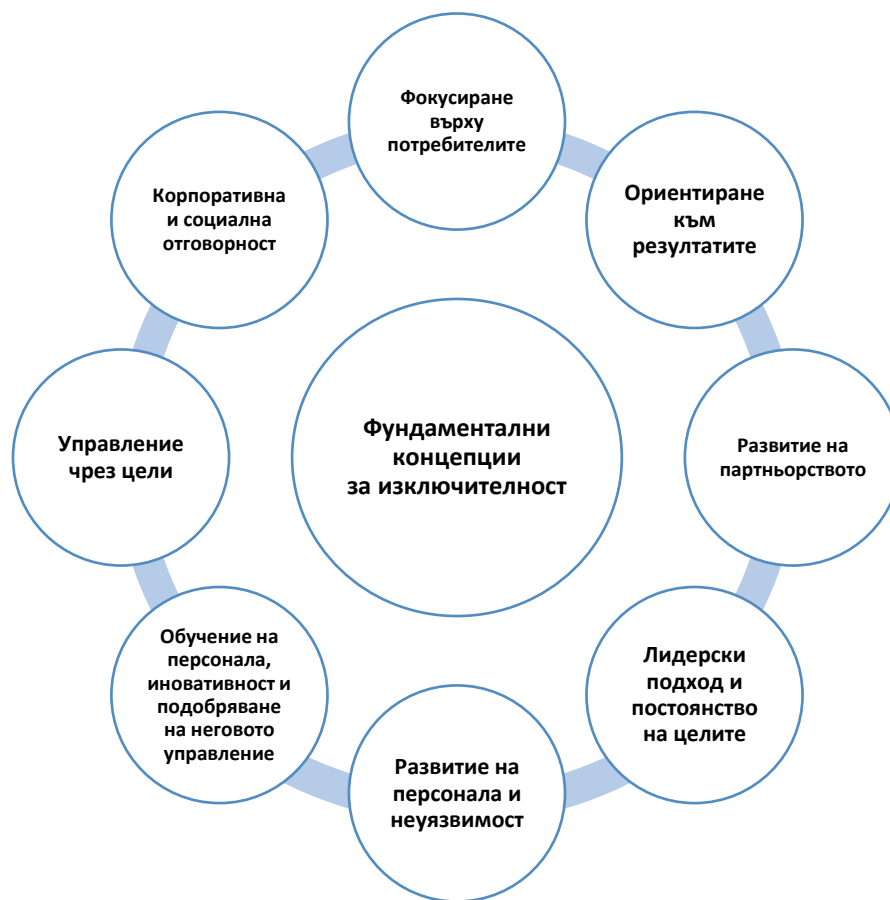
Фигура 1. Фундаментални концепции за изключителност

Други важни бизнес модели за управление на качеството, които намират приложение в практиката са свързани с осемте фундаментални концепции за изключителност (Fundamental Concepts of Excellence). Те са практически приложими, ефективни са за управление на качеството към настоящия момент на развитие на икономиката и са пряко свързани с осигуряване на устойчиво развитие.