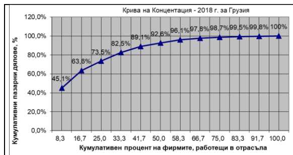
Фиг.1 Крива на концентрация за 2018 г.

На фиг. 1 и фиг. 2 е изобразена Кривата на концентрация за пазара на контейнерни морски превози за 2018 и 2019 г. При построяване на кривата са използвани пазарните дялове на фирмите опериращи на пазара за контейнерни морски превози за Грузия.