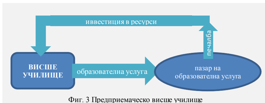
Фиг. 3 Предприемаческо висше училище

• Висшите училища се превръщат в предприемачи, т.е. приравняват се на всеки друг субект на пазарни отношения (фиг. 3). На практика това означава, че те трябва да се стремят да покриват голяма част от своите разходи със собствени финансови източници. Така например, в САЩ само 30% от разходите на висшите училища се покриват чрез финансиране от държавата. Висшите училища трябва да работят в тази посока – осигуряване на извънбюджетни средства, в т.ч. от стопанска дейност и от комерсиализация на научни резултати.