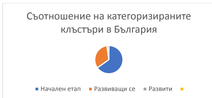
Фигура 3. Категоризирани кльъстърни на територията на Р България

Направеното проучване води до следните обобщаващи резултати: