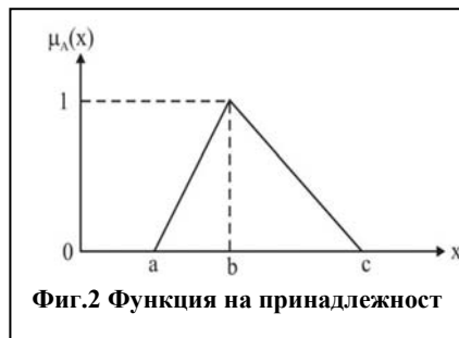
Фиг.2 Функция на принадлежност

Стъпка 1: всички възможни пътища представени с дължини L_i от i = 1, 2, \dots, n , където L_i = (a_i, b_i, c_i) .