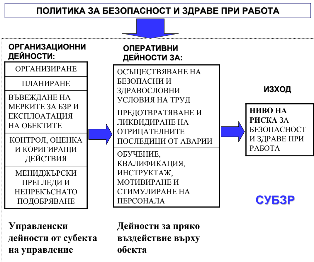
Фиг.3. Модел на дейностите за осигуряване на безопасност и здраве при работа.

С разглеждането на фирмата като система, състояща се от субект и обект на управление, тези дейности могат да се представят чрез обобщен модел, показан на фиг.3. Управленските дейности са тези, използвани от субекта на управление, а оперативните обхващат прякото въздействие върху обекта на управление.